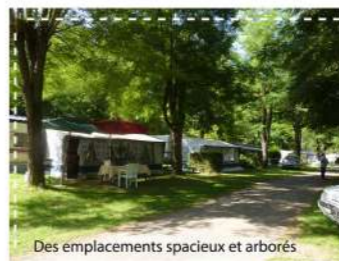
Des emplacements spacieux et arborés

Sur place Aire de jeux enfants / Structure gonflable / Ping-pong / Terrain de pétanque / Terrain Multi sports pour y pratiquer : Foot, Basket-ball, Volley, Badminton / Baby-Foot A proximité Randonnées / Equitation Accrobranche Trail / parapente