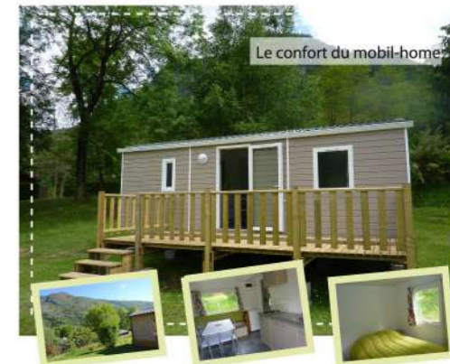
Le confort du mobil-home