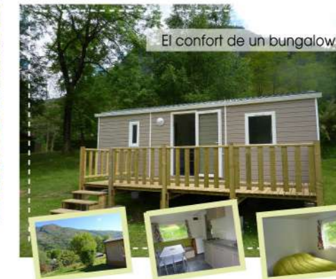
El confort de un bungalow