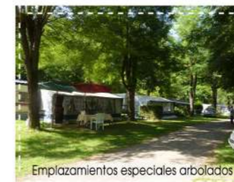
Emplazamientos especiales arbolados

Cerca de Excursiones / Equitación / Arborismo /Carreras de montaña / Parapente